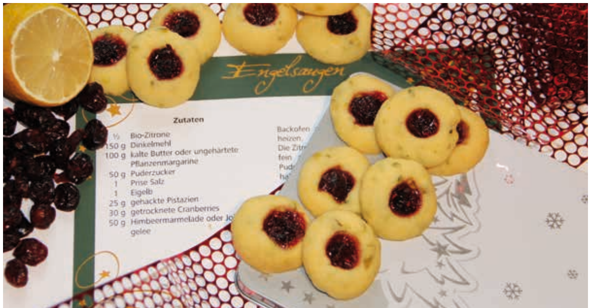
FRAGEN & FOTO: NICOLA M. WESTPHAL