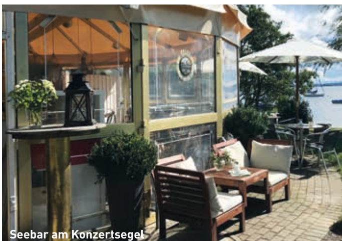
Seebar am Konzertsegel