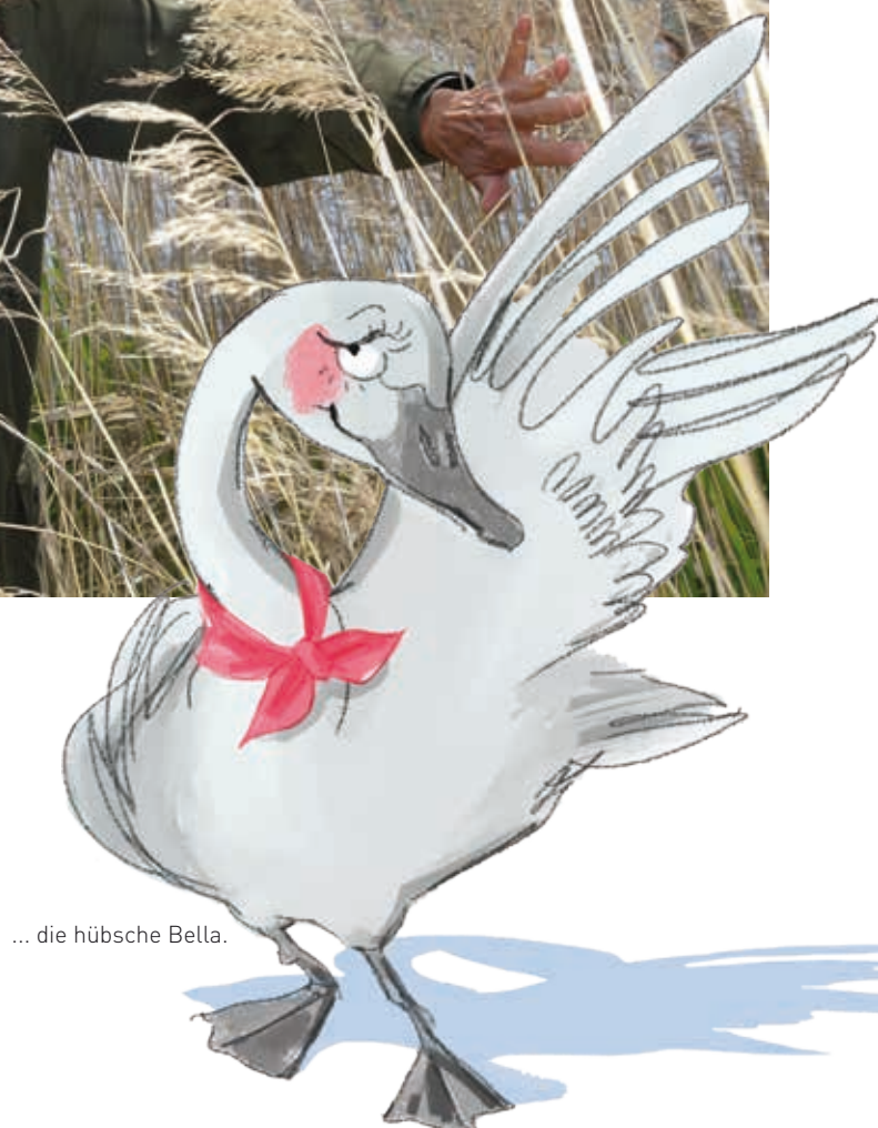
... die hübsche Bella.