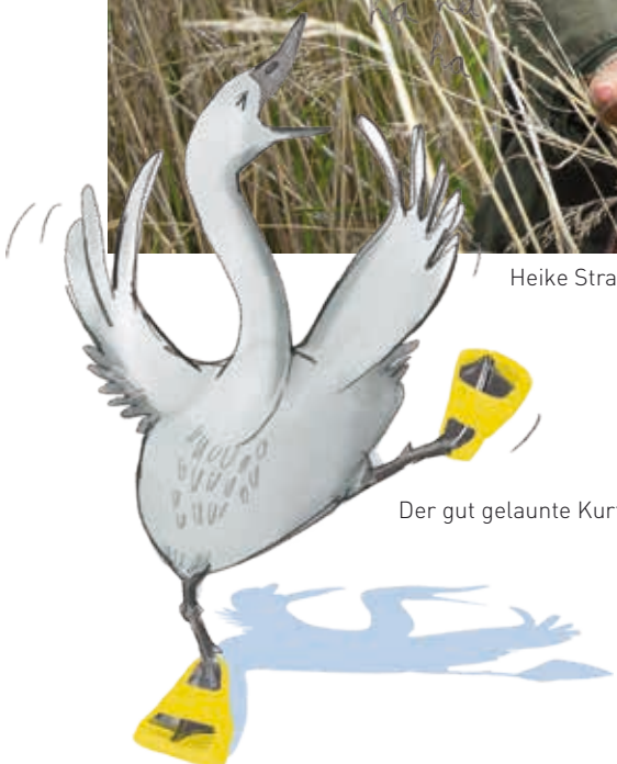
Der gut gelaunte Kurti und ...