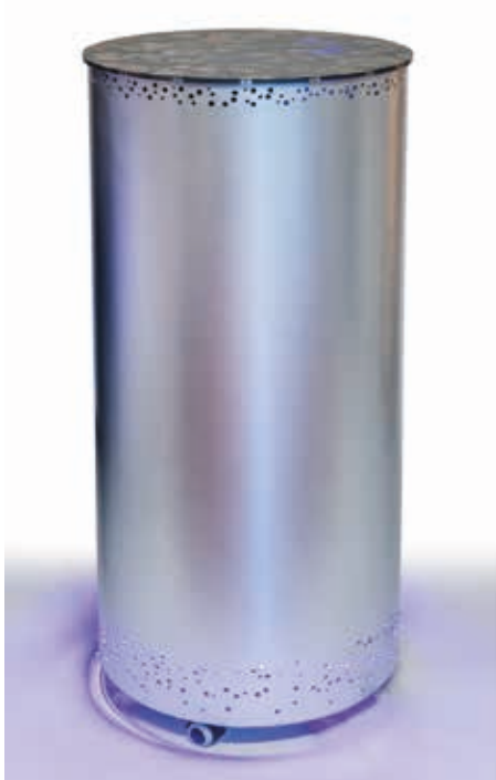
Der Laser-Luftdesinfektor zerstört zu 99,99 % alle Arten von Viren und Bakterien.