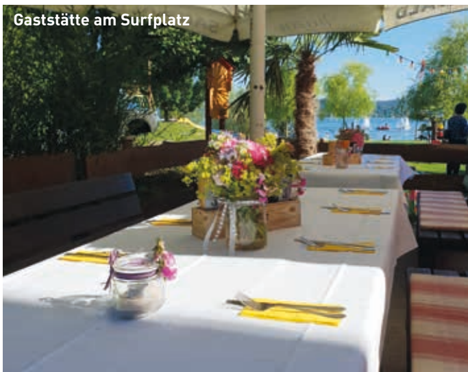
Gaststätte am Surfplatz