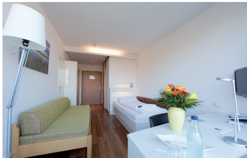
BEISPIELZIMMER IN DER WERNER-MESSMER-KLINIK

Die Werner-Messmer-Klinik mit ihren 211 Zimmern liegt in einer herrlichen Parkanlage welche direkt an den Bodensee grenzt. Die Unterkunft in der modernen Reha-Klinik erfolgt in Einzelzimmern der Kategorie Komfort. Zur Anlag der Werner-Messmer-Klinik gehört das Haus B. Es bietet seinen Gästen Hotelambiente.