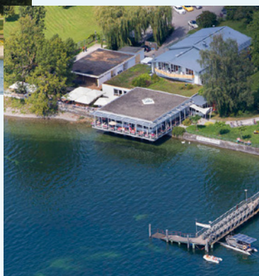
Haus E mit Strandcafé

Die Hermann-Albrecht-Klinik liegt unmittelbar am Bodensee und grenzt an ein Naturschutzgebiet. Das moderne Haus umfasst 121 Einzel- und Doppelzimmer. Das Therapielände und der Badestrand sind nur wenige Meter entfernt. Das Kurmittelhaus mit Schwimmbädern und Gymnastikhallen befindet sich in direkter Nähe.